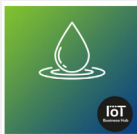
Replay : #IoT4Green - L'eau, une ressource vitale