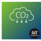
Replay : Hygiène connectée & qualité de l'air