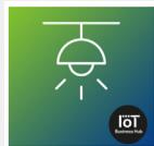
Replay : #IoT4Green - Eclairage public