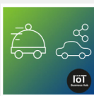
Replay : #IoT4Green - Logistique